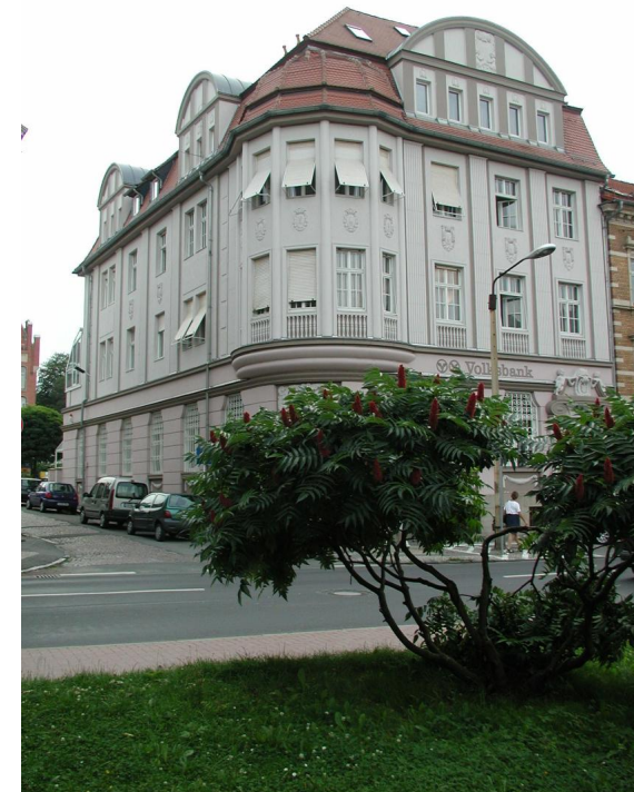
Hier ist die EthikBank zu Hause.