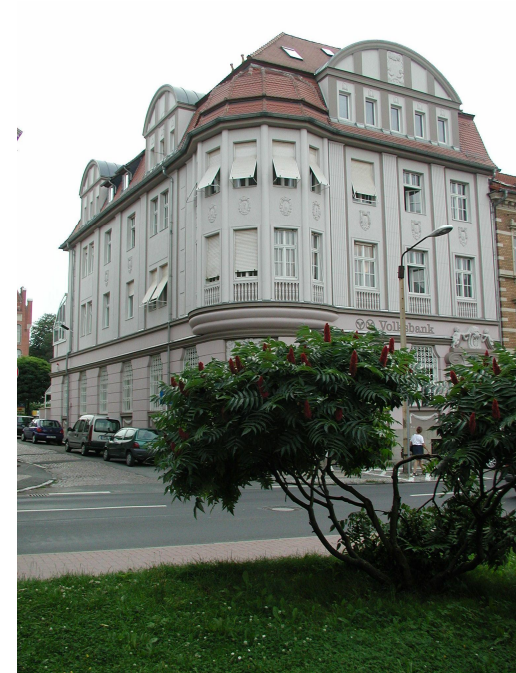
Hier ist die EthikBank zu Hause – in Eisenberg in Thüringen.